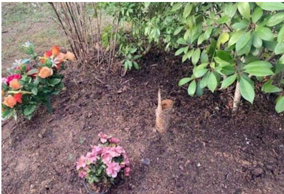
Le 14 février 2019, on a replanté un nouveau chêne au même emplacement